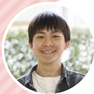
幕張ヒューマンケア学部 健康科学科3年

高校よりも、授業やプライベートでも自由な時間が増えてきて楽しいです。自分で考えて決めていくことが多いですが、これから色々なことを勉強し、視野を広げながら大学生活の中で自分に合う将来像を見つけられるようにしていきたいです。