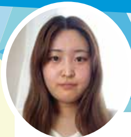
幕張ヒューマンケア学部 看護学科3年

私が初めての病院実習で学んだことは、個別性です。同じ疾患を持っていても同じケアでは患者様にとっては十分なケアとは言えないということを学びました。個別性のあるケアをするためには「相手のことを知る」ための技術が必要で、実際に患者様と話してみてもとても難しいと感じました。しかし患者様を知ろうとする姿勢を持つことで個別性のあるケアにたどり着くとも感じました。領域別実習までに、自分の知識と自信を持って患者様に満足してもらえるケアに繋がられるように、イメージを持って知識や技術を身につけたいと考えています。