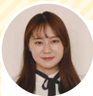
沼津ヒューマンケア学部 看護学科4年