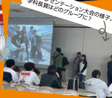
写真プレゼンテーション大会の様子。 学科長賞はどのグループに？