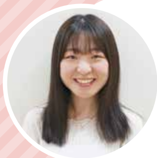
幕張ヒューマンケア学部 健康科学科3年

他学科の様々な科目を履修することで、なりたい自分を探することができます。その中で成績の向上と資格をできるだけ取得し、就職の選択肢を大いに広げていきたいと考えています。また、学校の行事にも積極的に参加し貢献していきたいです。