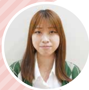
幕張ヒューマンケア学部 健康科学科1年