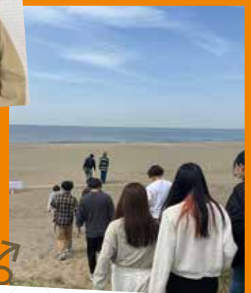
大学周辺を散策。 幕張キャンパスは海へも徒歩圏内！