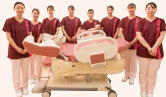
▲2024年度 助産師課程の学生