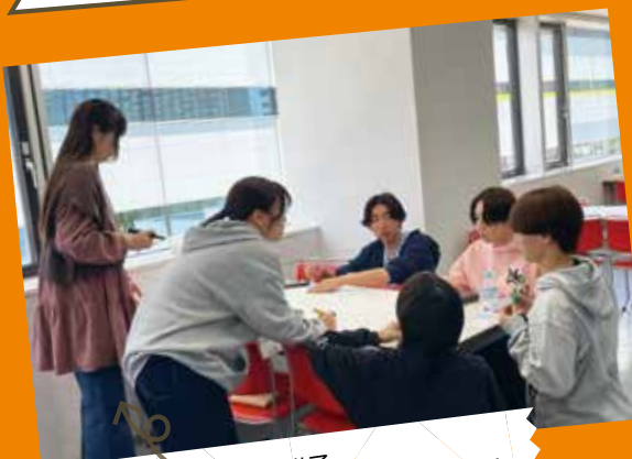
グループワークの様子。 お互い協力しながら楽しい時間を共有！