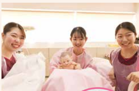
▲医師による新生児蘇生法の授業の様子