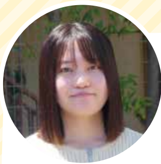
沼津ヒューマンケア学部 看護学科3年生

看護師・保健師の国家試験まで1年をきりました。ダブル受験は想像以上に大変だと思いますが、合格に向けて最後まであきらめずに全力で励み、私の理想とする看護師・保健師を目指して頑張りたいと思います。