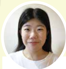
幕張ヒューマンケア学部 看護学科3年