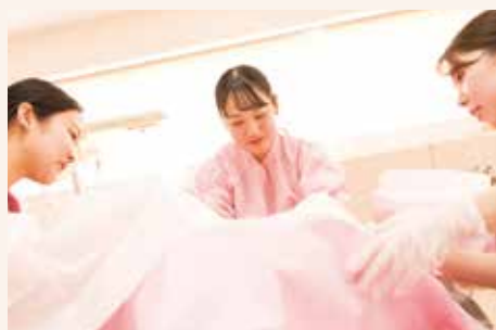
▲分娩介助技法 練習の様子▲