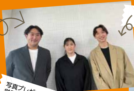
参加してくれた3名の卒業生。 みんな立派に活躍中！