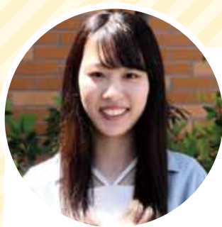
沼津ヒューマンケア学部 看護学科4年

また、妊娠から出産までは危険と隣り合わせであり奇跡の連続であることを改めて学び、生まれてきたことに対する喜び、生んでくれた母、育ててくれた両親と家族への感謝の気持ちと命の尊さを忘れず生きていきたいと思いました。