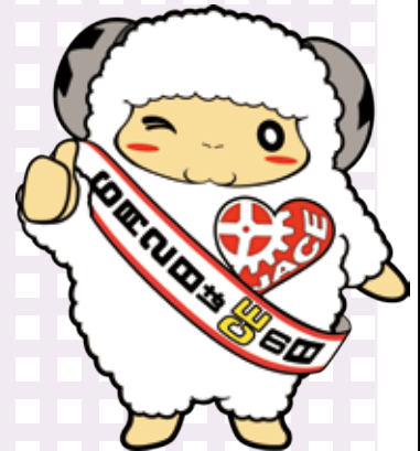
マスコットキャラクター シープリン

医療×工学×情報を学び、日本の医療現場に貢献し、活躍できる臨床工学技士を目指すため、東都大学で充実したキャンパスライフを送りましょう!