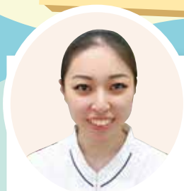
幕張ヒューマンケア学部 看護学科3年